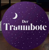
Bett Paio