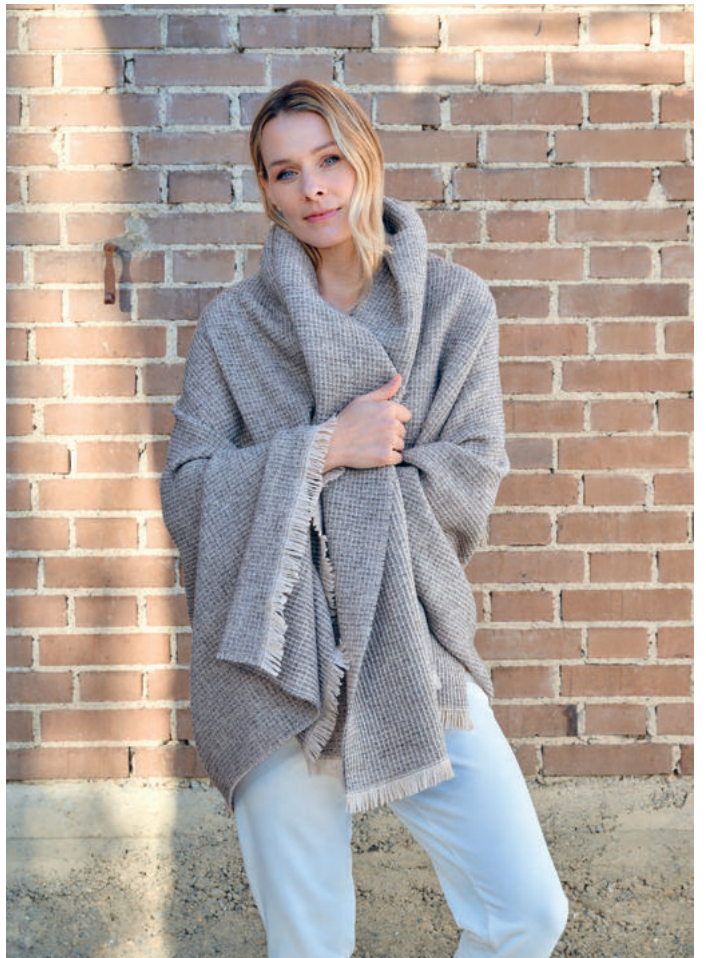
SILVRETTA Schurwolle / virgin wool